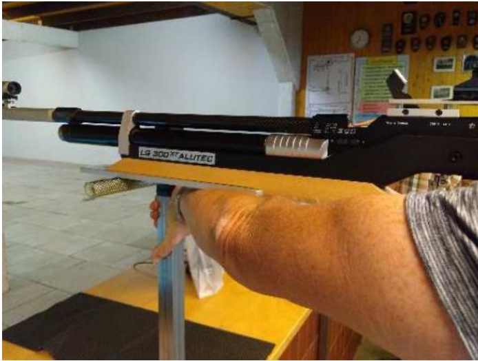
Waffe liegt auf dem Arm