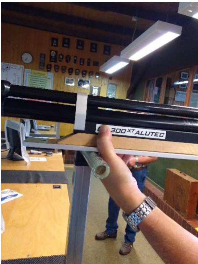
Hand liegt an Auflage