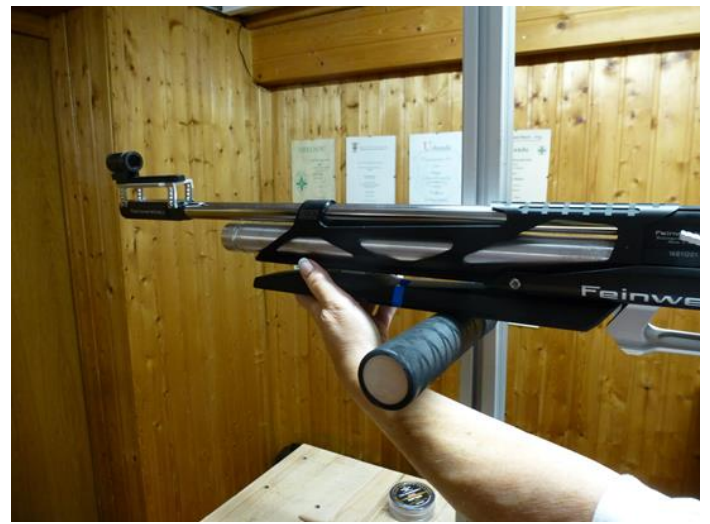
Hand liegt zwischen Auflage u. Mündung